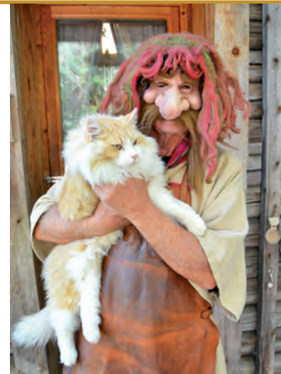
Trolles katt heter Trollmix