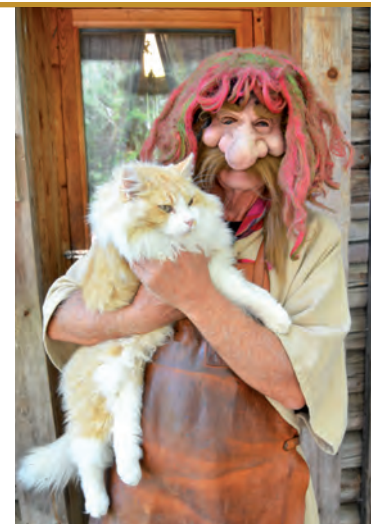
Trolles katt heter Trollmix